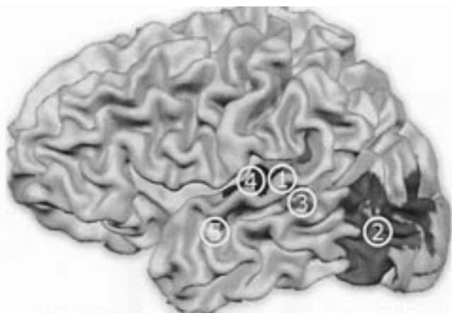
1 = verwerking van fonemen; 2 = verwerking van grafemen; 3 = letter-klank associaties; 4 = modaliteit van foneemactiviteit door letters; 5 = identificatie van een congruent letter-klank paar

Uit: Dyslexie in Nederland , Blomert, hoofdstuk 'Van fonologische verwerking naar grafeem-foneem associaties'